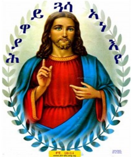
ቼምስና መድሓኒ ዓለም ካቶሊካዊት ቤተክርስቲያን ቻርለት

November day 28; 2015 ዓመታዊ በዓል ቅዳሴ ናይ ቼምስና መድሓኒ ዓለም ቅዳሴ ስለ ዝግበር :: ኩሉኹም ምእመናን ኣብ ቅዳሴ ክካፈል ኣጥቢቁ እላበወኩም : ቦታ ክሕብረልኩም እዩ። ንኹብሪ መድሓኒ ኣለም ተሰማሚዕኻ ክበዓል ይግብእ።